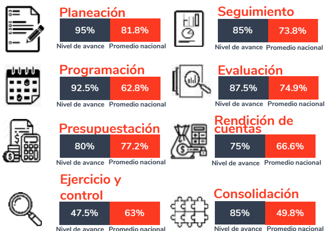
Tabla 1. Resultados del diagnóstico por sección en el estado de Puebla, 2020